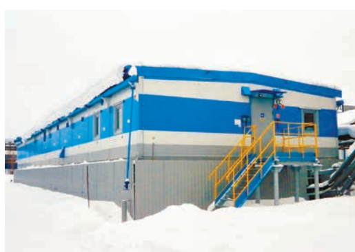
ЗРУ-6 кВ «Песчаная»