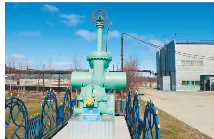
Памятник пангодинскому водозабору

История Надымского филиала берет свое начало с освоения самого первого ямальского месторождения Медвежье. В феврале 1972 года в Пангодах запустили под нагрузку первую электростанцию ПЭС-1600, которая положила начало развитию большой энергетики в приполярных широтах западно-сибирской части России. Уже в октябре 1975 года было организовано отдельное Управление электрических и тепловых сетей «Надымэнергогаз», в структуре которого созданы энергоэксплуатационные пароводоцеха в городе Надым и посёлке Пангоды.