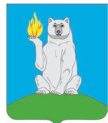
Герб поселка Пангоды

Сидящий на холме медведь (аллегория названия газового месторождения), держащий в лапе пламя (символ газовой отрасли) – все это раскрывает и подчеркивает значимость поселения Пангоды в развитии освоения территорий Севера России.