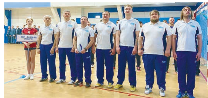
Команда Надымского филиала готова побеждать!