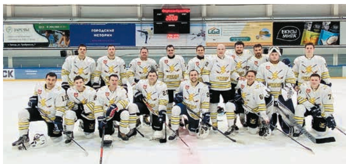
Победители – команда HC ENERGO

«Настрой на игру с ГТМ был боевой – выходили на лёд, чтобы победить. Соперники отлично провели всю серию игр, одержав победу в прошлом матче. Но мы его разобрали, проанализировали ошибки и на этот раз уже их не допустили. Финальный матч серии команда ГТМ провела на высоком уровне, но у нас были чёткие установки тренера – не давать сопернику раскатываться и играть „в свою игру“. А главный упор был сделан на оборону и быстрые контратаки. Матч получился насыщенным и интересным, а победа заслуженной!» – прокомментировал игру второй ассистент капитана, защитник