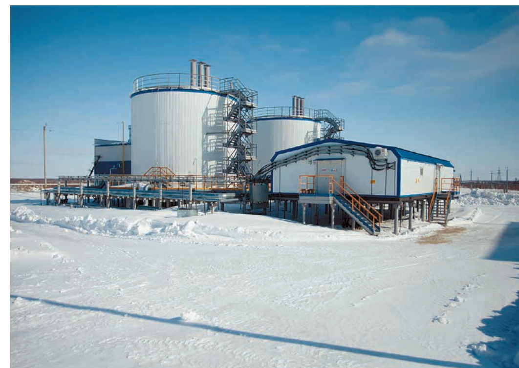
Насосная станция ВЖК Медвежинского НГКМ

Народ северных веками связан с природой, и все орнаменты взяты из окружающего мира. У хантов в основном теплые цвета – красный (огонь, закат), желтый (солнце), зеленый (трава, тундра), синий (небо, вода). Вся природа отражена в орнаменте. Тут и заячья ушки, и локоть лисицы, и сломанная ветка кедра. Кстати, если орнамент перевернуть, то и значение меняется: были, например, «заячья ушки», а стали «головки человека».