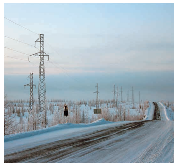
ВЛ 110 кВ электроснабжения Медвежинского НГКМ