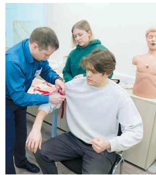
Тренинг по оказанию первой помощи